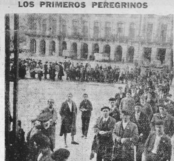
Para postarse a los pies del Apóstol, ha llegado a Santiago la primera peregrinación colectiva del presente Año Santo: es la del valle del Uba, integrada por más de quinientas personas. He aquí a la larga comitiva de peregrinos penetrando en la Basílica compostelana por la puerta del Obradoiro. (Foto Ksado).

Art. 8.º Los colocados percibirán todos los devengos y gratificaciones que tengan asignados los de su mismo cometido en los diversos servicios. Los que hayan de mejorar su aptitud en la forma prevista en el artículo quinto, se considerarán como telegrafista segundo y si terminaran el cursillo sin aprovechamiento, podrán ser propuestos para repetirlo.