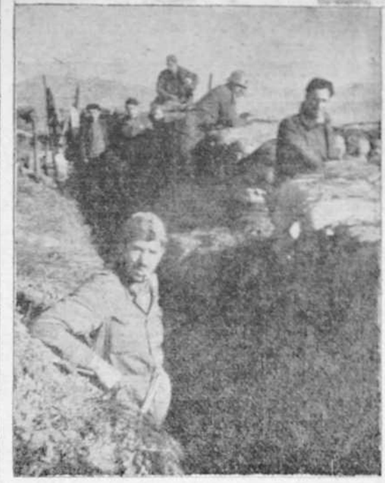
Nuestros soldados se asoman tranquilamente a sus parapetos en las líneas avanzadas de Asturias

Canallada dentro de un patriotismo absurdo y necesario, expresada con la acobardada y fementida saqueada, escurrada y huera, que caracterizaba los discursos de Asala, por ejemplo, esta manera de solear la realidad era de indudables efectos y repercusión en la mente entenebrecida del rebano isousterista.