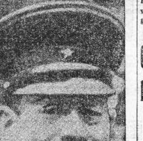
El general Matsui, comandante en jefe de las fuerzas japonesas que operan en el Norte de China.

LOS CUARELES, DESTRUIDOS. TOKIO, 31.—Se confirma que en la ciudad de Tung Chu han sido asesinados 300 japoneses que allí residían, por las tropas del ejército de Nankín. El presidente del Gobierno autónomo de Honán ha ordenado la detención de numerosos chinos en cantidad de rebeldes. Siguen los combates entre chinos y japoneses en las cercanías de Tien Tsin. Los bombardeos aéreos sobre esta ciudad así como los proyectiles de la artillería han destruido la Universidad Central y los cuarteles y otros edificios. BOMBARDEO AEREO JAPONES.