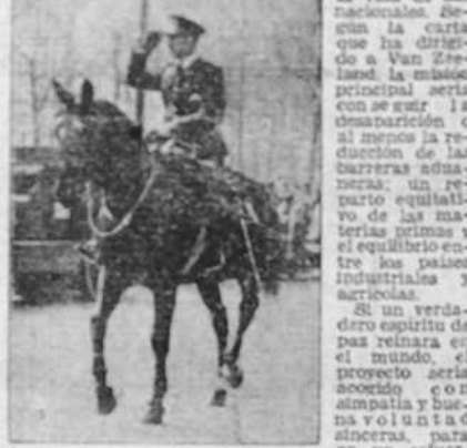
EL REY LEOPOLDO DE BELGICA

La prensa francesa se opone al proyecto del rey belga de mediar entre las naciones. El artículo afirma que el rey belga está actuando en beneficio propio, y que su proyecto no es beneficioso para las naciones.