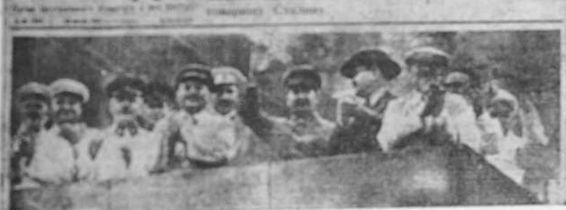
Una foto tomada en la "Pravda". El grupo se reúne en la mañana laboral, entre el ruido de máquinas. El camarada que muestra una foto es Stalin con un grupo de obreros. En el fondo se ve el edificio de la "Pravda" en Moscú.