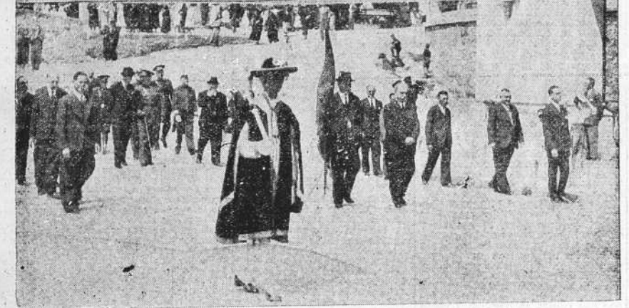
El Ayuntamiento coruñés regresa al Palacio Municipal después de haber asistido a la ceremonia de la renovación del Voto de la ciudad en la iglesia de San Jorge