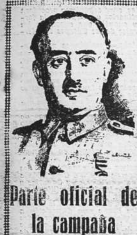
Parte oficial de la campaña

SALAMANCA, 17. —Parte oficial de guerra del Cuartel General del Generalísimo, correspondiente al día de hoy, 17 de septiembre de 1937. Segundo Año Trienal. EJERCITO DEL NORTE FRENTE DE ASTURIAS. En el sector oriental ha continuado el avance, ocupándose por una de nuestras columnas el pueblo de Tresvizo, en el que se cogieron algunos prisioneros. También han operado otras fuerzas sin que se sepa la línea que han alcanzado a la hora de redactar este parte. En el sector occidental sólo ha habido algunos cañones.