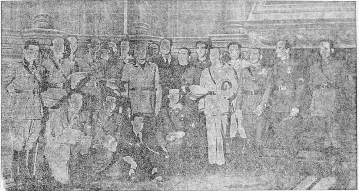
ROMA.—EL DUCE RECIBE A LOS OFICIALES ESPAÑOLES HERIDOS QUE, INVITADOS POR EL GOBIERNO FASCISTA, SE ENCUENTRAN PASANDO SU CONVALESCENCIA EN TIERRAS DE ITALIA

No les importa la hecatombe mundial, la buscan con la vaga esperanza de prolongar sus turbios negocios y su existencia más turbia todavía. Pero ya está avisado el mundo: los rojos intentan otra infamia.