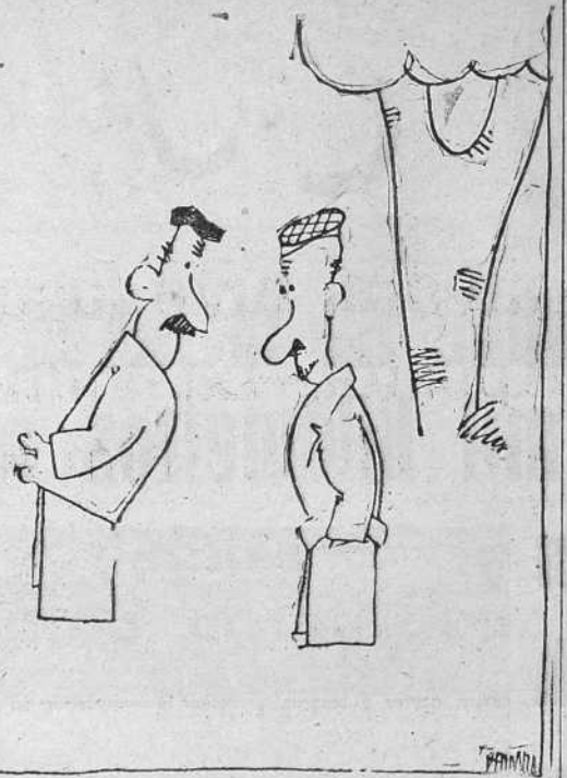
-Tenemos que convencernos de que nos engañan como a chinos. -¡Si; pero nosotros ya hace tiempo que no tragamos nada!