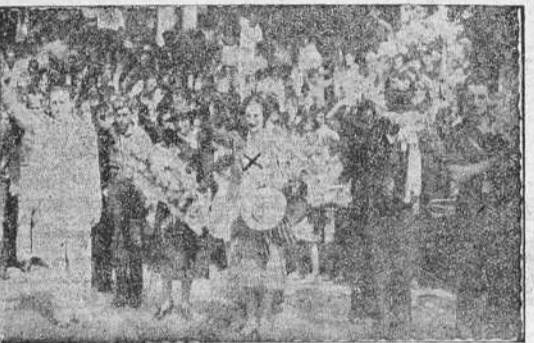
La esposa del señor Serrano Suñer, que fué obsequiada con un ramo de flores a su llegada a la estación coruñesa (Foto Cancelo).

El Ministro se dirigió al Gobierno civil. Ante los insistentes aplausos y vitores del público estacionado ante el edificio, el señor Serrano Suñer se asomó a uno de los balcones, acompañado de su esposa, y dirigió a los coruñeses las siguientes palabras: