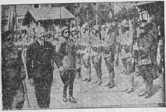
El señor Serrano Suñer revisando las tropas que le rindieron honores a la llegada a La Coruña.

Al partir para el centro de la ciudad, la comitiva, se cantó el himno "Cara al Sol" y se vitoreó entusiásticamente a España y al Generalísimo.