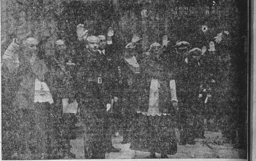
A la salida de la Catedral, el Sr. Ministro y las Autoridades, escuchan, brazo en alto, el himno Cara al Sol.