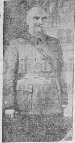
Don Manuel García Diéguez, Alcalde de Santiago