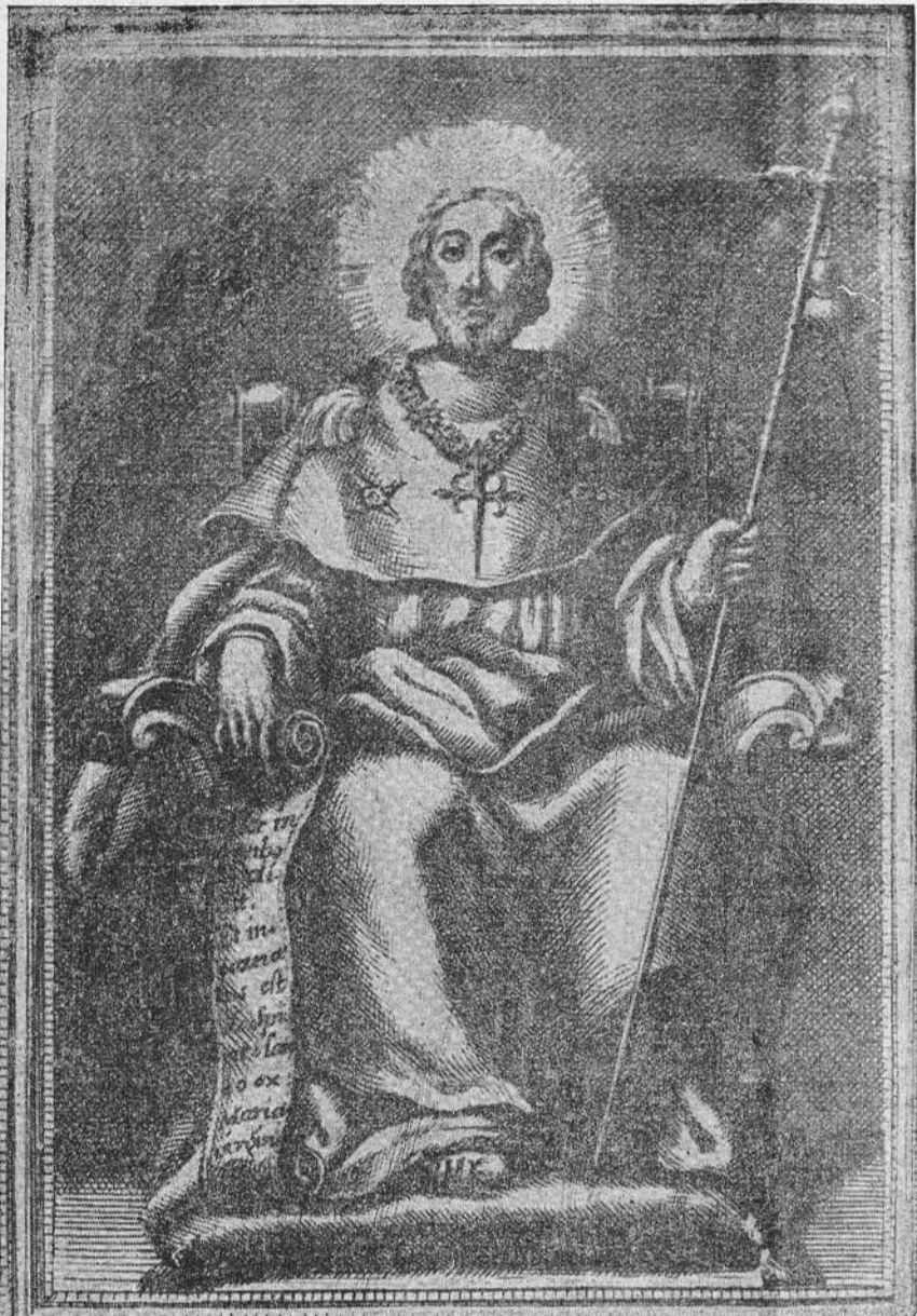
V.º Ret.º del Apóstol Santiago el Mayor Patron de las Españas que se venera por la R. Congreg.ª Nacional y Originar.ª del Reyno de Galicia en Madrid

El número de prisioneros que hasta ahora pudo precisarse se eleva a cinco millares