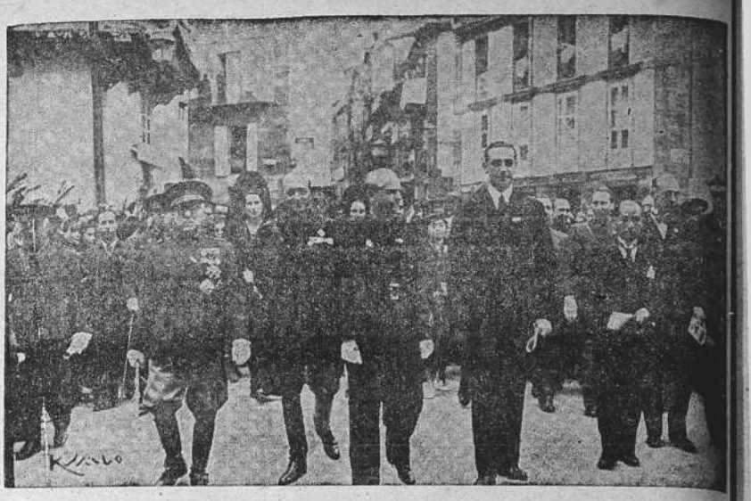
La comitiva desfilando por las calles compostelanas en dirección a la Catedral, para asistir a la ceremonia de la Ofrenda (Foto Ksado).

SE REUNE LA COFRADIA DE CABALLEROS DE SANTIAGO BURGOS 25.—La Real Cofradía de Caballeros de Santiago ha celebrado brillantes actos con moti-