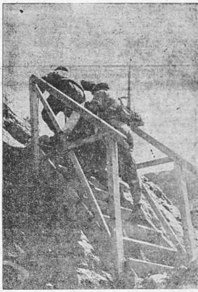
En la roca viva los Ingenieros nacionales han montado esta escalera que salva un paso peligroso.

PARIS, 2.—Hoy se celebró un Consejo de ministros en el Palacio del Elíseo, bajo la presidencia de M. Lebrun. Al terminar la reunión se facilitó un comunicado en el que se dice que ha sido examinada la situación interior. Daladier pronunció un discurso, que duró una hora, para exponer la política del momento. El ministro de Hacienda, monsieur Machandeau, informó que todavía estaban sin ultimar los presupuestos a causa de los Ministros de Guerra y Aire. Después presentó un proyecto de creación de una comisión económica.