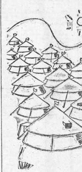
CAMPAMENTO. —¿Me haces el favor de decir dónde puedo comprar una pastilla de jabón? —[No lo sé; por aquí no hay ninguna tienda!]

"Pues también les han fallado y seguirán fallándoles los manejos para lograr una mediación que termine en una componenda. Eso sería la negación de nuestro Movimiento, recto, potente, arrollador y revolucionario, en el sentido de que no quede el rastro de nada de lo que condujo a España a su catástrofe en estos últimos años de desgobierno y de insensateces. Victoria rotunda ha de ser y será la nuestra. Victoria que ha de tener como corolario la extirpación absoluta de cuantas lacras carcomían a España. "Es que valdría la pena tanto sacrificio para acabar "en tablas"? Volveríamos al pasado, pero con mástiles de mayor gravedad, si esto fuera posible. Tal cosa sería la negación absoluta de nuestro Movimiento, repita. Los que piensan así, los que lo sostengan, son traidores a la Patria. La España Nacional rechaza con indignación tal hipótesis."