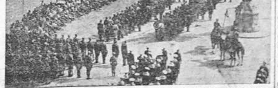
BILBAO.—Los tenientes provisionales de la Academia de Toledo renuevan el juramento a la Bandera. Con este motivo se celebró una misa de campaña en la Plaza de España. Vista parcial de la ceremonia

La jornada brillantísima trajo el contingente de muertos y prisioneros que ya son como el pan cotidiano y en el ambiente bélico de la tarde, al finalizar el día, una esperanza de nuevas realizaciones en plan de mayor velocidad.