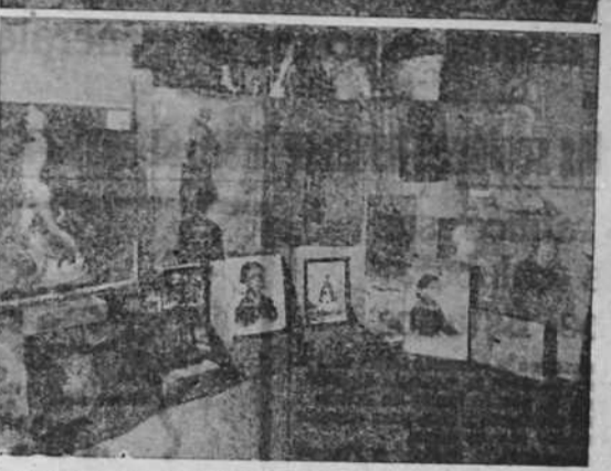
Dos aspectos de la exposición de trabajos de los alumnos de la Escuela de Artes y Oficios...