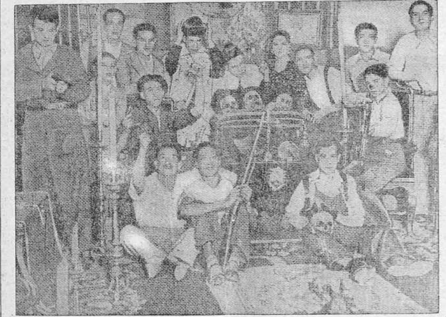
Esta es la España roja. Estos son los que, vencidos, quieren una mediación. Los restos de esos hermanos, que están ultrajando, nos señalan el camino: el exterminio de la horda.

La absoluta irreductibilidad de ideologías, programas, procedimientos y realizaciones de los dos partidos contendientes en esta guerra civil española y la vital importancia de lo que en ella se discute y ventila: que afecta a las entrañas mismas de la Patria y a sus principios más consustanciales y consuetudinarios, no susceptibles de mer-