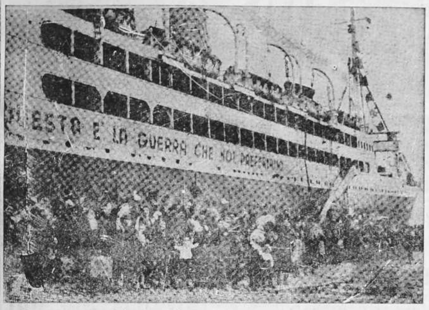
Un grupo de colonos italianos preparándose para embarcar en Génova para dirigirse a Libia

Libia recibió su nombre de la hija de Egeo y Casiope, que se llamaba así, la cual se casó con Neptuno, de quien tuvo dos hijos, Agenor y Beio. Pero había de pasar mucho tiempo desde la época en que es localizada esta bella historia mitológica hasta el día en que para celebrar el XVI aniversario de la marcha sobre Roma el Duce Benito Mussolini declara a Libia parte integrante del territorio na- Alrededor de la casa, las tierras que componen cada granja han sido aradas y sembradas en parte. Para la otra parte, el labrador hallará en el granero las semillas. En muchos casos, plantaciones de viña, olivos, naranjos y limoneros canjan ya a hermosa canchón tierra y verde allí donde hace cinco años sólo cantaban las arenas del desierto movidas por el simón. Cada poblado tiene una plaza Las 1.900 familias han sido cuidadosamente elegidas entre seis mil solicitantes, prefiriéndose a las que carecían de posesiones en Italia y sostienen más hijos capaces de trabajar. De hecho, la primera condición para ser elegida, que una familia tiene que cumplir, es la de tener por lo menos tres hijos y dos hijas aptos ya para el trabajo. La salud y la aptitud física han sido