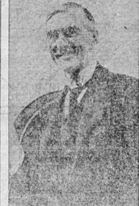
CHAMBERLAIN. Jefe del Gobierno británico