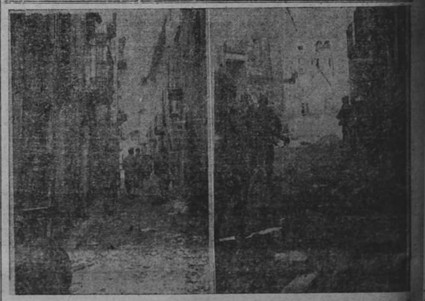
Soldados naciales ocupando el pueblo de Ascó, en el Ebro.

Este le rogó que volviese a su ministerio. Aquella extraña coincidencia de que una joven, "conseguida a Dios", pero sin recursos ni instrucción alguna, hiciera con las niñas lo que, años antes, había empezado él a hacer con los niños fué para su espíritu así como una especie de visión profética. Aquella joven tenía las apariencias de la misma producción. Se fué al pueblo; examinó atentamente a la "Presidenta" y a sus "Hijas de María"; trató el asunto con el párroco; y terminó diciéndole que allí tenía el embrión de una Orden religiosa; que sería "el ala femenina" de la Congregación Salesiana, que había de extenderse por todo el mundo.