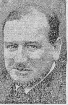
DALADIER. Jefe del Gobierno francés