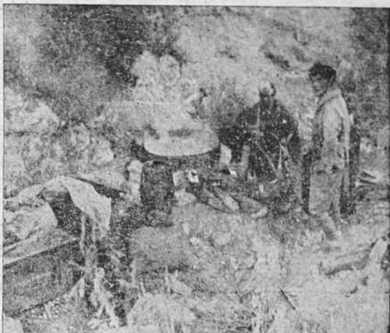
La hora del rancho en uno de los frentes de combate.