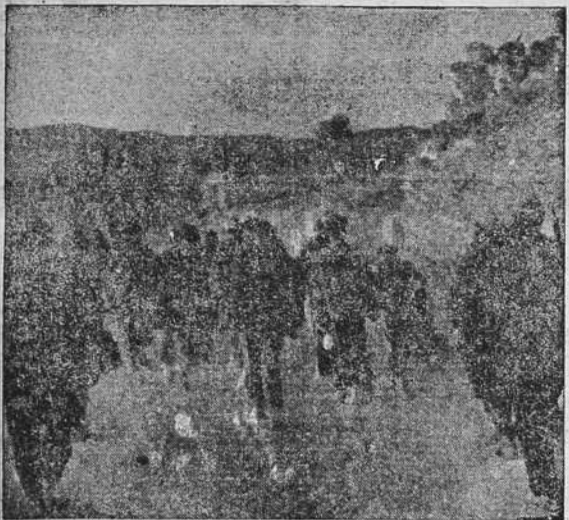
Prisioneros rojos, conducidos a un campo de concentración.