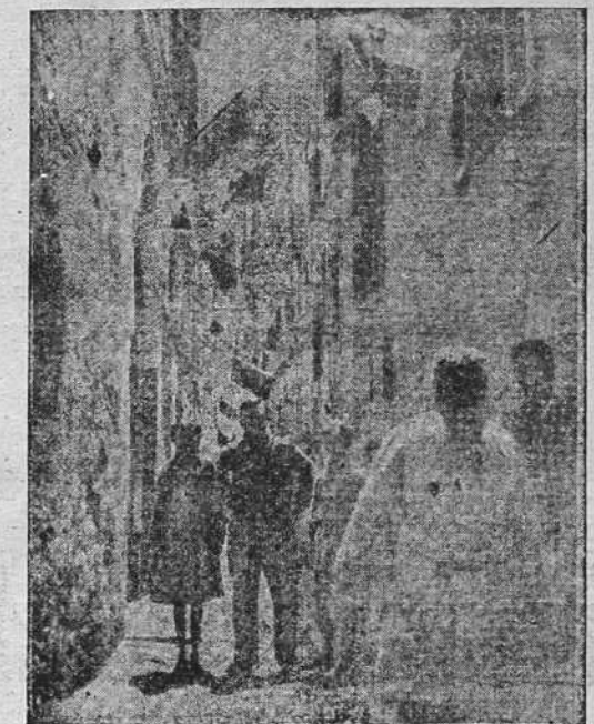
Una calle de Tünez el día de la demostración antiitaliana. Como se ve los vecinos de éste no se manifestaron precisamente contra Italia. De todas las ventanas y balcones cuelgan banderas romanas

El nombramiento del nuevo ministro de Asuntos Exteriores en sustitución de Petrescu, que dimitió, se relaciona con el propósito del Rey Carol de inyectar sangre joven al Gobierno, dejando a los viejos políticos en situación de consejeros. El nuevo ministro es muy amigo de la Gran Bretaña.