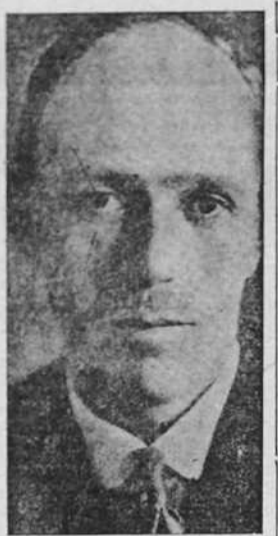
Lord Halifax, ministro de Relaciones Exteriores de Gran Bretaña

En el “Evening Standard”, Duff Cooper publica un artículo que es muy significativo, pues, como se recordará, Duff Cooper abandonó el cargo de primer lord del Almirantazgo por mostrarse disconforme con la política de paz concertada en Munich. Sin embargo, ahora se muestra partidario de un mejoramiento en las relaciones italo-inglesas y califica las conversaciones que van a tener lugar en Roma como las más importantes de las celebradas en los cuatrocientos últimos años. Añade que Italia es la única nación cuyos intereses están todos concentrados en el Mediter-