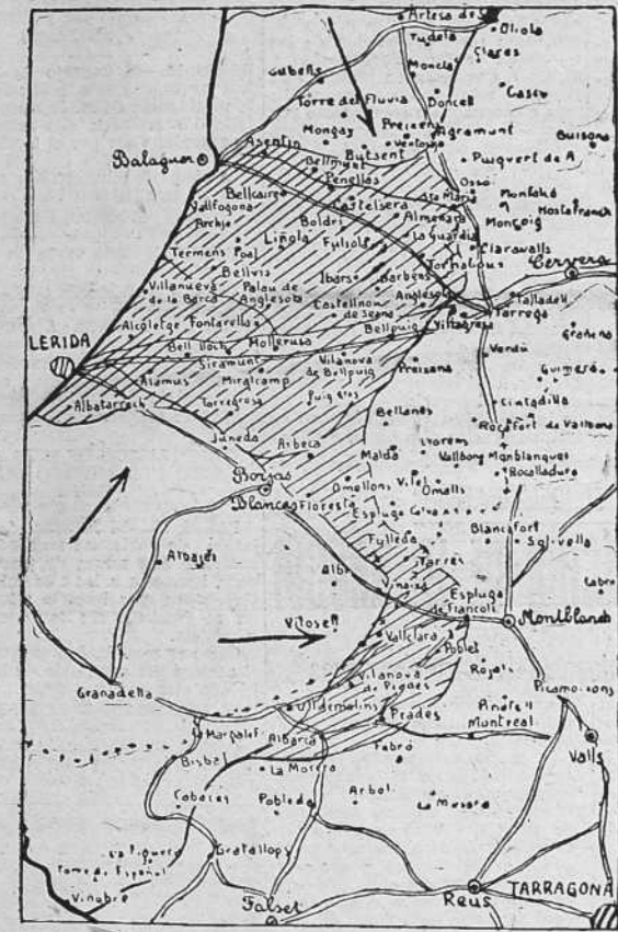
El espacio rayado representa, aproximadamente, la extensa zona catalana liberada por los soldados de Franco en las victoriosas jornadas del domingo y lunes últimos. Dicha zona comprende cuarenta y dos pueblos, muchos de ellos de gran importancia. Toda la comarca es feracísima. (Croquis EL IDEAL GALLEGU).

En el Sur, disminuye la presión del enemigo, muy quebrantado en las últimas jornadas