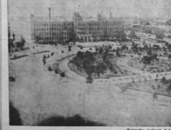
Aspecto actual del centro de Hain-King, capital del Estado del Manchukuo