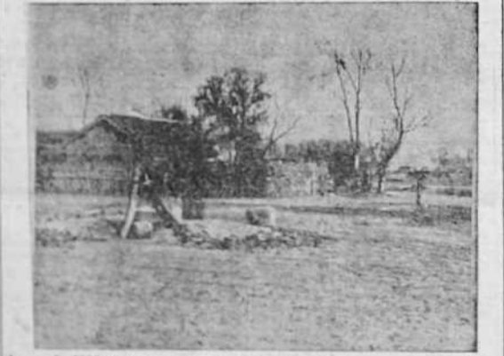
Aspecto actual del centro de Hain-King, capital del Estado del Manchukuo

Y “resistir” cueste lo que cueste es la consigna.”