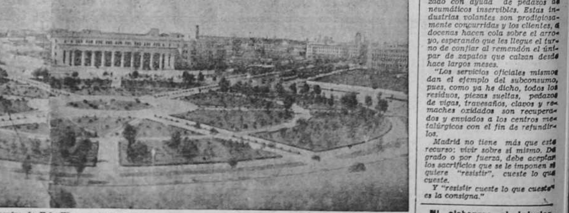
Aspecto actual del centro de Hain-King, capital del Estado del Manchukuo

Ni alabanzas ni injurias. Sólo la verdad en “Haz”.