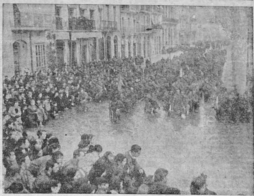
Uno de los primeros cuidados de las tropas del Generalísimo Franco, apenas conquistada la ciudad de Tarragona, ha sido el de restablecer el culto católico, que había desaparecido completamente desde el mes de julio de 1936, por no haber ni un solo templo en condiciones de celebrar los cultos, ya que todos habían sido o incendiados o saqueados. En la Rambla Nueva, y al pie del monumento a Roger de Lauria, se celebró una solemne Misa de campaña, a la que asistieron las fuerzas conquistadoras de la ciudad, y una enorme muchedumbre de la población civil. Aspecto de la Rambla Nueva en el momento de la Misa, con las fuerzas rindiendo honores.

Entramos dramas no son únicos. No son tampoco el fin de una serie. Preparémoslos a ver casos