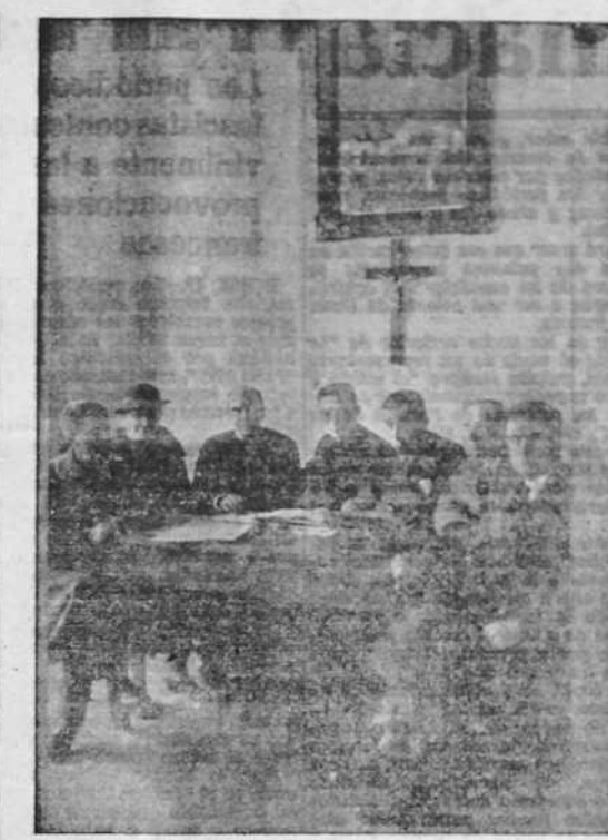
Los maestros católicos de Galicia se han reunido en Orense, presididos por el Crucifijo y el retrato del Caudillo. (Foto Villar).

En la primera decena del mes de febrero se celebrará en Jofre un gran festival a beneficio de "Prentes y Hospitales", en el cual el Cuadro Lírico Ferrolano llevará a escena la preciosa ópera de Ferrin