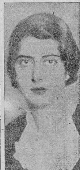
Su Alteza Real la Princesa Maria de Saboya, hija menor de Sus Majestades los Reyes-Emperadores de Italia, que contraerá matrimonio el día 23, con el príncipe Luis de Borbón Parma

Al cabo de treinta días de constante ofensiva, nuestros soldados han rescatado para España la extensa y rica zona que aparece rayada en nuestro plano. A esta zona reconquistada hay que añadir las considerables porciones de territorio catalán ocupadas en la jornada de ayer y que rebasan la línea del frente trazada en nuestro croquis.