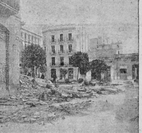
Las tropas del Generalísimo Franco han encontrado la importante ciudad de Tortosa, situada en las proximidades de la desembocadura del río Ebro, casi destruida por las tropas del gobierno de Barcelona, en su retirada.—Este es el desolador aspecto en que se encuentra una de las más importantes calles de Tortosa, en la actualidad.

"Es decir que entre los dos Gobiernos actuales que existen en España, nosotros nunca hemos escondido nuestra preferencia; nos ha sido dictada tanto por el buen sentido como por nuestra fe".