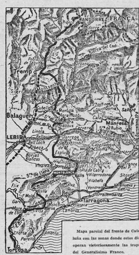
Mapa parcial del frente de Cataluña con las zonas donde estos días operan victoriosamente las tropas del Generalísimo Franco.