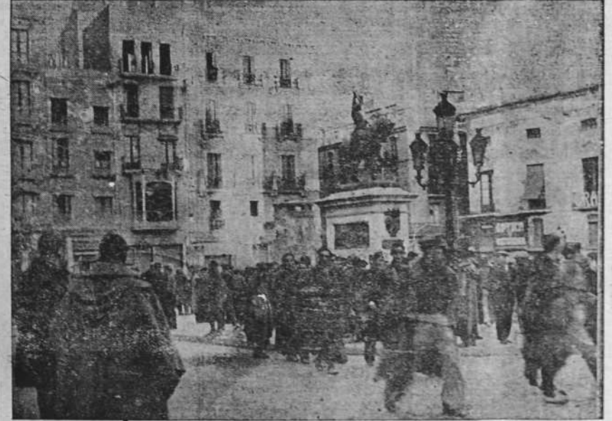
REUS.—Durante la dominación del Gobierno Negrin en la importantísima ciudad de Reus, patria del general don Juan Prim, destacado político liberal del siglo XIX, la estatua de aquel insigne hombre público fue mutilada: se le arrancó la espada para que quedase en el salmo marxista del puño en alto. Plaza de Prim, en la ciudad de Reus, con la estatua mutilada, de aquel general. Los soldados del General Franco le han enruinado la mano en una bandera bicolor y le han colocado en la cabeza una bolina roja.—(Foto CIFRA).

Se reciben en el Gobierno civil importantes ofrecimientos para ayuda a las poblaciones liberadas