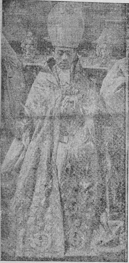
El Pontífice recibe la "adoración" de los Cardenales