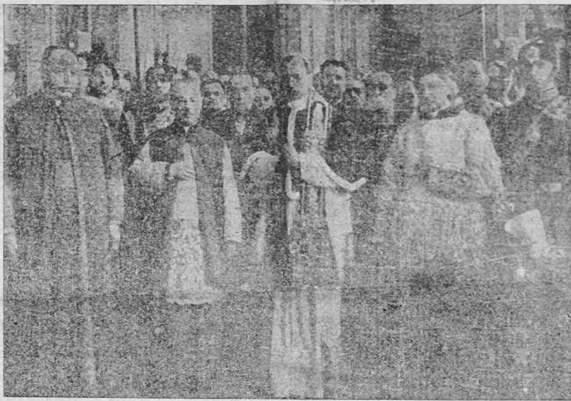
El Papa atraviesa la Logia de Rafael para dirigirse a la Capilla Sixtina

La costa mediterránea entre Sagunto y Adra, cerrada para la navegación Cualquier buque que contravenga esa orden será apresado Los barcos que intenten acercarse a la costa por Cartagena, serán hundidos por los submarinos