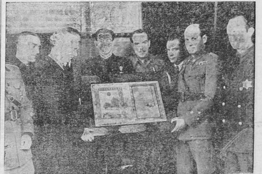
EL MINISTRO DE LA GOBERNACION, INTERVENTOR HONORARIO DE QUETAMA BURGOS.—El secretario de la Alta Comisaría de España en Marruecos, capitán Castillo, ha hecho entrega al Ministro de la Gobernación de un artístico pergamino, regalo de todos las Intervenciones del Majzén, por el que se nombra al señor Serrano Súñer interventor honorario de primera de la kábilas de Quetama. Acto de la entrega del pergamino, celebrado en el despacho oficial del Ministro de la Gobernación.

ROMA, 8.—El avión que ha efectuado el vuelo rápido sin escalas Roma-Addis Abeba (4.500 kilómetros) en el plazo de 13 horas 25 minutos, a una media de 400 kilómetros por hora, ha realizado la mayor parte del vuelo durante la noche, ya que habiendo salido de Roma a las diez de la noche del 6 del corriente, aterrizó en Addis Abeba el 7 por la mañana a las 11.50 (hora local). El aparato llevaba a bordo tres pilotos, un operador y un mecánico, y está provisto de dos motores de 1.000 HP cada uno, y es el modelo para la aviación civil tomado de los aparatos de bombardeo y que se emplea en la aeronáutica desde hace varios años.