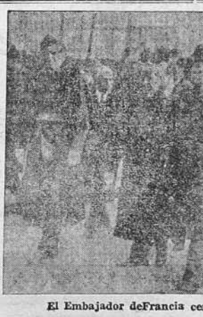
El Embajador de Francia cerca de nuestro Gobierno, al entrar en la España nacional

BURGOS 20.—Las declaraciones atribuidas al Alto Comisario de España en Marruecos, en el periódico francés "Le Jour", de París, del 17 del actual, son completamente apócrifas y falsas en absoluto. La Alta Comisaría las desmiente oficialmente.