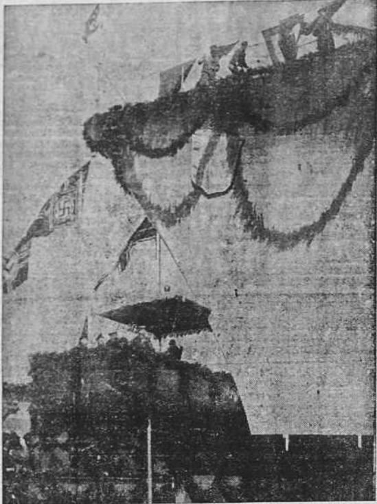
La botadura del nuevo acorazado alemán Tirpitz, de 35.000 toneladas, en la ciudad de Wilhelmshaven, en presencia de Hitler. Momento de ser bautizado el acorazado.

Esta manifestación causó penosa impresión en todos los círculos, que subrayan el plan de excitación y odio que Francia está desarrollando en los medios musulmanes contra Italia y Alemania.—Stéfani.