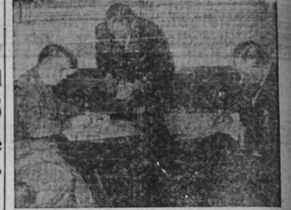
Los ministros de Relaciones Exteriores de Alemania y Dinamarca, señores von Ribbentrop y Zahle, en el momento de firmar el pacto de no agresión germano-danés

PARIS, 6. —En Bucarest, el húngaro Popovski derrotó a Dabinski, por puntos, conquistando el campeonato europeo de los pesos ligeros.