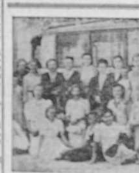
El mariscal de Francia Pétain visita las fortificaciones de Teruel

FLORES PARA LOS ALTARES Las personas que desean ofrecer flores para adornar los altares en los que ha de ser expuesto el Santísimo, pueden entregarlas en la Iglesia parroquial de Santiago.