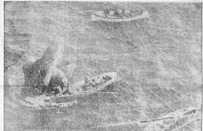
Durante las frustradas operaciones de salvamento del submarino británico "Thetis", varios buques se aproximaron a la popa del navío siniestrado, que emergía sobre la superficie.