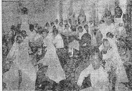
Los niños de Auxilio Social que hicieron la primera Comunión fueron obsequiados con un rico desayuno en el comedor de la calle del Sol