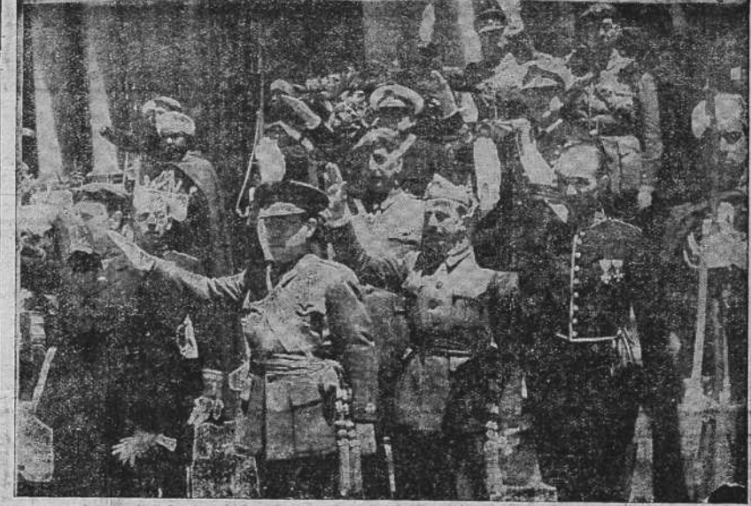
El Gobierno despidiendo al Caudillo a la puerta del Palacio de Capitania, de Burgos, después del acto de presentación de Cartas Credenciales de los Embajadores de Perú y Estados Unidos.

El Caudillo contestó al alcalde con un discurso. BILBAO, 19.—El domingo por la tarde se organizó una solemne procesión a Begonia. Saló de Bilbao a las seis de la tarde, y detrás de la comitiva iba una caravana de automóviles. Desde el Ayuntamiento a la Basílica de Begonia, cubrían la carretera fuerzas de la cuarta División de Navarra, uniformadas con camisa azul y boina roja. Una gran muchedumbre se agolpaba a ambos lados del trayecto. Ante la Basílica estaban esperando varios generales, Almirantes, Cuerpo diplomático y consular, diversas personalidades, comisiones del Ejército y las jerarquías de Falange Española Tradicionalista y de las Jons.