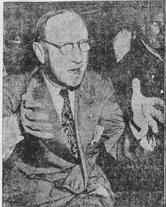
El general norteamericano George Van Horn Moseley, retirado ya del servicio, compareció ante el Comité Investigador de Actividades Anti-Americanas, ante el cual denunció las maquinaciones comunistas de elementos perniciosos que se mueven en los Estados Unidos. El general aparece en un instante de su informe, que ha despertado viva curiosidad en los Estados Unidos.