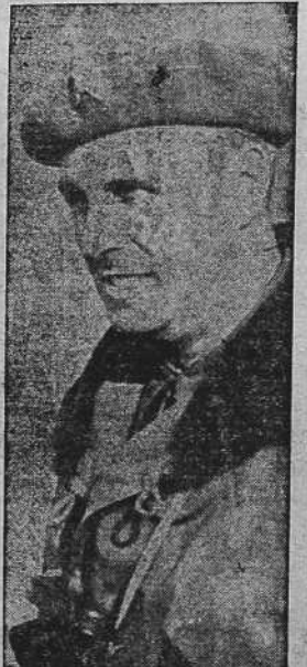
El general don José Solchaga, que ha sido nombrado general jefe de la Octava Región Militar

BURGOS, 5.—El Boletín Oficial del Estado de hoy publica las siguientes disposiciones del Ministerio de Defensa: Decreto ordenando el cese en el mando de la Cuarta Región militar, por pase a otro destino, del general de División don Eusebio Alvarez Arenas. Otro ordenando el cese en el mando de la segunda Región del general de brigada don Ignacio de las Landeras. Otro ídem ídem en el mando de la Quinta Región, del general de brigada don Francisco Rañoy Carvajal. Otro ídem en el mando de la Tercera Región del general de brigada don Marcial Bravo García. Decreto disponiendo el cese en el cargo de jefe superior de las Fuerzas Militares de Marruecos, del general de brigada don Carlos Guerra Zagala. Otro, disponiendo cese como comandante general de Baleares, por pasar a otro destino, el general de brigada don Enrique Cánovas de la Cruz. Otro, disponiendo que como consecuencia de la reorganización provisional del Ejército, cese como Comandante general de Canarias, el general de brigada don Vicente Valderrama. Decreto nombrando jefe de la primera región militar (Madrid) al teniente general don Antonio Saliquet, actual jefe del Ejército del Centro. Otro nombrando general jefe de la segunda región militar (Sevilla) al teniente general don Gonzalo Queipo de Lano, actual jefe del Ejército del Sur. Otro nombrando general jefe de la tercera región militar (Valencia) al general de división, don Antonio Aranda, actual jefe del Ejército de Galicia. Otro nombrando general jefe de