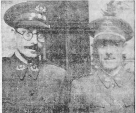
El general Asensio, nuevo Alto Comisario de España en Marruecos, fotografiado en unión del Alto Comisario y actual Ministro de Asuntos Exteriores coronel Beigbeder.

Italia y el Japón habían sido informados del pacto por Berlín