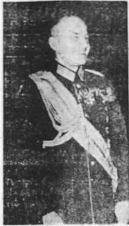
VON BRAUCHITSCH Generalísimo de los Ejércitos alemanes

LONDRES, 1.—Una nota oficial publicada hoy en Londres informa que el Gobierno no reconoce los motivos que han llevado a pronunciar la proclama de incorporación de Dantzig al Reich y mucho menos la validez de esa incorporación. Dice que aunque el Decreto del Senado de 23 de agosto nombró "Gau-leiter" a Forster y que dicho Decreto estaba en contradicción con la Constitución de la Ciudad Libre y violaba, por tanto, lo instituido por la Sociedad de Naciones, el Gobierno inglés, para evitar provocaciones, no adoptó medidas acerca de esa decisión del Senado. Pero ante el Decreto de esta mañana y el hecho que quiere presentarse como consumado, de la anexión de la Ciudad Libre tiene que declarar que Dantzig fué colocada bajo la protección de la Sociedad de Naciones y su Estatuto fué establecido por un tratado del cual fué parte signataria la Gran Bretaña. Los derechos concedidos a Polonia en Dantzig están confirmados por convenios entre la Ciudad Libre y Polonia. Se estima que la acción de esta mañana representa la fase final de esa repudiación unilateral de la Constitución dantziguesa, que sólo puede ser revocada por negociaciones entre todas las partes signatarias.