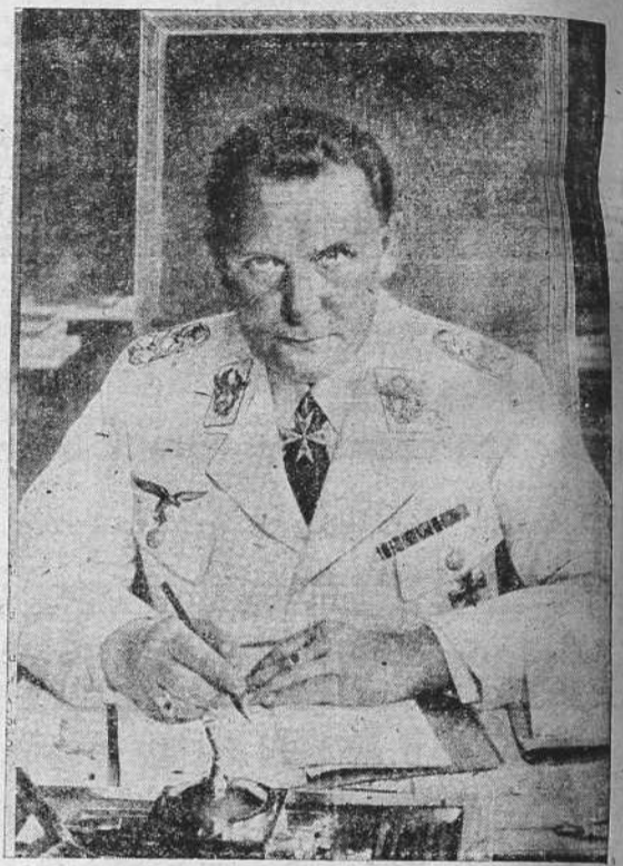
El mariscal Goering, designado solemnemente por el Führer como sucesor en la Cancillería del Reich, en el caso de su muerte

"Esta mañana lanzó el Canciller alemán una proclamación al ejército de su país que indicaba claramente que estaba a punto de ser atacada Polonia. Las informaciones que acaban de llegar a manos de los Gobiernos de Londres y París nos dan a conocer que las tropas alemanas habían pasado la frontera polaca y tenían lugar encuentros entre las tropas de las dos partes. En estas circunstancias, creen los Gobiernos de Francia e Inglaterra que por tal decisión el Gobierno alemán ha creado condiciones de un acto exclusivo de fuerza contra Polonia, atentándose contra la independencia polaca, lo que obliga a ambos Gobiernos a cumplir el compromiso que tienen con Polonia de ir en su ayuda. En estas condiciones tenemos el deber de informar al Gobierno alemán, que si menos de que dé completa satisfacción a los Gobiernos de S. M. Británica y de Francia y la seguridad de que cesará toda actividad agresiva contra Polonia y que está dispuesto a retirar sus tropas del territorio polaco, estos dos Gobiernos de Londres y París no du-