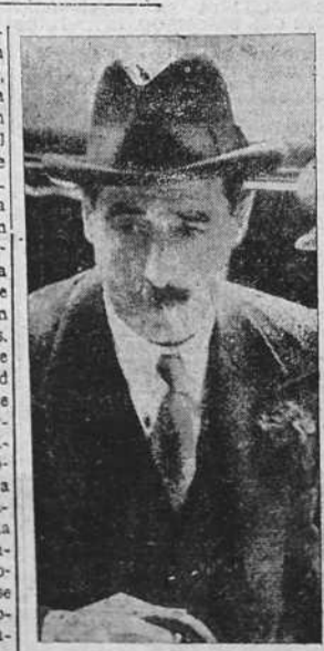
Mr. Neville Henderson, Embajador de la Gran Bretaña en Berlín, que estos días actúa de intermediario entre Hitler y Chamberlain

La afirmación de Hitler para justificar la actitud alemana no puede comprenderse, porque en realidad las propuestas a que se refiere no han sido comunicadas nunca a Varsovia. También nosotros esperábamos esas propuestas y nuestro embajador en Berlín pidió al ministro de Relaciones Exteriores alemán, von Ribbentrop que enviara al embajador de Polonia para hacerle saber las referidas propuestas y que las co-