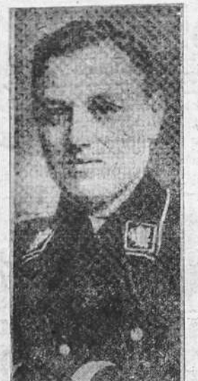
ALBERTO FORSTER Jefe del Estado de Dantzig, que ayer decretó la anexión de la ciudad libre al III Reich

hacia el Reich que jura a vos, mi Führer, una perdurable gratitud y una eterna lealtad. Heil Hitler."