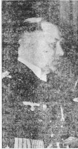
EL ALMIRANTE READER Jefe de la flota de guerra del Reich