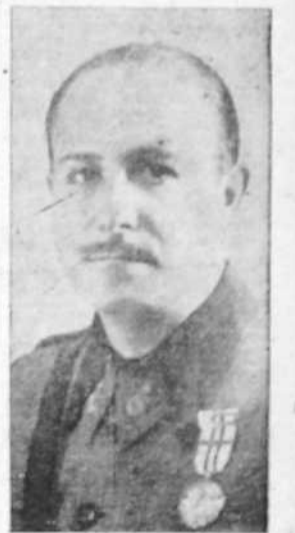
Don José Finat y Escrivá de Roman, Conde de Mayalde, nuevo Gobernador civil de Madrid.

El IDEAL CALLECO celebra intensamente el nuevo nombramiento del laureado general y desea a este una feliz gestión al frente del Gobierno Militar de esta provincia y plaza.