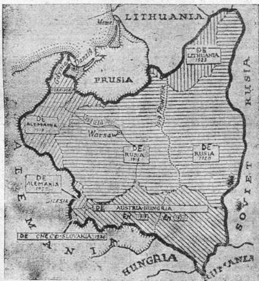
Un mapa de Polonia en el que aparecen señalados los territorios de otros países que fueron agregados al polaco

La reunión duró veinte minutos y asistieron, entre otros consejeros, lord Runciman.