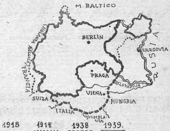
VARIACION DE LAS FRONTERAS ALEMANAS

La privilegiada situación de la Prusia Oriental, que de región aislada pasa a ser sólida vanguardia del Reich en Oriente, sería el caso de guerra con Rusia perpetua amenaza de flanco al frente estratégico de la vida y amplia puerta para el desarrollo de la maniobra. Su posición le permite desembarcar a retaguardia del Vistula y cortar parte de las comunicaciones de Varsovia. Se convierten en plazas fronterizas