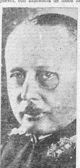
El general von Fritsch, comandante general del Ejército alemán en el año de 1938, que ha muerto durante la batalla por la conquista de Varsovia.

BERLIN, 25.—Los últimos honores militares que se tributarán al general von Fritsch, muerto en acción de guerra, tendrán lugar el jueves, con asistencia de todos los