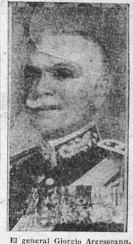
El general Giorgio Argesseann, presidente del Gobierno rumano, que acaba de prestar juramento ante el Rey Carol