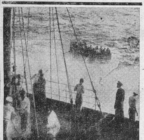
Salvamento, en pleno Atlántico.—Los supervivientes de la tripulación del barco inglés "Kafiristan" hundido por un submarino alemán, son recogidos a bordo del buque "American Farmer".