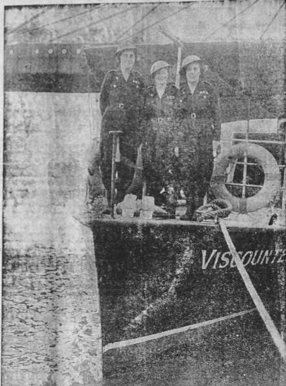
LA MUJER INGLESA EN LA GUERRA.—El servicio femenino de ambulancia fluvial que presta auxilio en el Támesis en tiempo de guerra. Tres jóvenes voluntarias a bordo del buque-ambulancia "Viscount". (Foto PANDO).