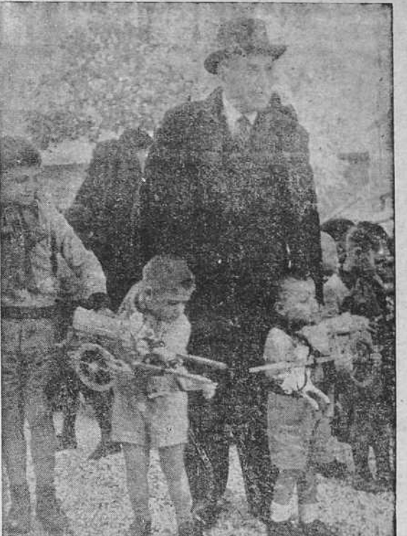
El Embajador de España en Roma, señor García Cende, ha visitado, con motivo de las fiestas de Navidad, el Asilo romano de San Antonio, para llevar regalos a los huérfanos de los legionarios italianos caídos en España.

o más tarde, pues la violencia de las sacudidas demuestra que el fenómeno geológico se desarrolla a 16 millas de profundidad, y requerirá mucho tiempo antes de que quede definitivamente terminado.—(R. N.) OLA DE FRIO EN YUGOSLAVIA E ITALIA BELGRADO 29.—Actualmente reina en Yugoslavia una verdadera ola de frío. En la capital croata se ha registrado una temperatura de 32 grados bajo cero.—(EFE) MILAN 29.—Se registra actualmente en Italia una intensa ola de frío. En Trieste hace un viento glacial, cuya velocidad, de más de cien kilómetros por hora, ha hecho descender la temperatura a seis grados bajo cero. Los barcos que se hallan en puerto han tenido que reforzar sus amarras. El mar presenta un aspecto amenazador. Todos los ríos de la región de Isontro y los lagos de Montafione se han helado. Un anciano murió de frío.—(EFE)