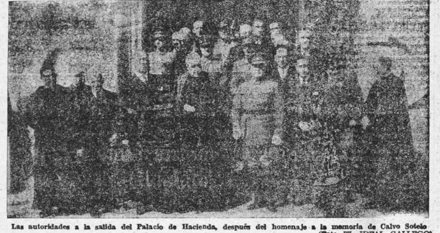
Las autoridades a la salida del Palacio de Hacienda, después del homenaje a la memoria de Calvo Sotelo

Realizada la ceremonia de la bendición y del canto de la bandera que José Calvo Sotelo, balbuceaba palabras de agradecimiento hacia todos