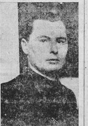
LEON DEGRELLE ha sido fusilado

BERLIN 6.—La Agencia DNB publica un informe de fuente competente con respecto al número de parados que existen en Alemania, cuyo número ascendió a fines de mayo de 1940 a 37.500, entre los cuales no figura ningún obrero especializado. La agricultura—industria textil han sido puestas en pie de guerra.—(EFE).