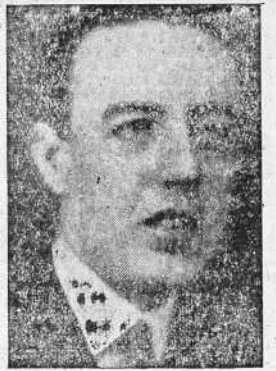
JUAN GIL ARMADA

EL IDEAL GALLEGO ha querido tener de boca del señor alcalde de Santiago de Compostela, Excmo. señor Marqués de Figueroa, una impresión de las aspiraciones de la ciudad del Apóstol, en orden a su resurgir material y darlas a conocer en este día del Patrón de España como un com-