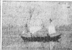
La pequeña y singular embarcación hawaiana que ayer tarde zarpó para Honolulu