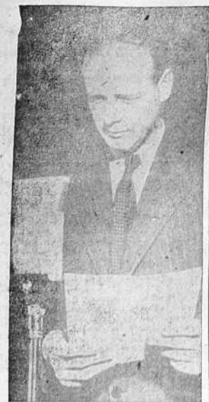
El coronel Lindbergh que ha pronunciado un importante discurso por radio en el que abogó por una colaboración de Nortamérica con Alemania.

ROMA, 7.—"Popolo de Roma" dice que son vanas las ilusiones del Gobierno francés al pretender merecer la gracia de Alemania por medio de reformas interiores y procesos contra los responsables. La Francia de la derrota no logrará engañar a nadie y menos a Alemania. Su espíritu no ha cambiado nada, como lo prueba la afirmación de Weingart de que no ha terminado aún la misión del Ejército francés.—(EFE).