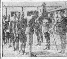
Los soldados de Intendencia juraron ayer la bandera