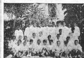
Niños de las Colonias Escolares que salieron un mes de vacaciones