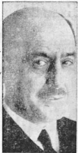
Excmo. Sr. D. Salvador Moreno Fernández, ministro de Marina

Por disposición del Caudillo, una lámpara votiva arderá perennemente ante la Patrona de los marineros