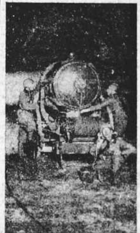
Los reflectores de la defensa antiaérea italiana funcionan constantemente durante la noche para evitar cualquier sorpresa por parte de la aviación enemiga. Potentísimos rayos de luz cruzan el espacio en todas direcciones.

No sabemos lo que habrá de cierto en las noticias difundidas ayer por algunas agencias periodísticas, según las cuales las gentes huyes precipitadamente de Londres. Si esto es así, pensamos que la huida es el comienzo de la derrota. Lecciones bien recientes nos lo han demostrado. De todos modos, sea cuales fueren las consecuencias de estos terribles bombardeos, una cosa es bien cierta: la catástrofe de Londres bajo los bombas alemanas, la destrucción de centenares de vidas, el resquebrajamiento de su sistema de producción y defensa que