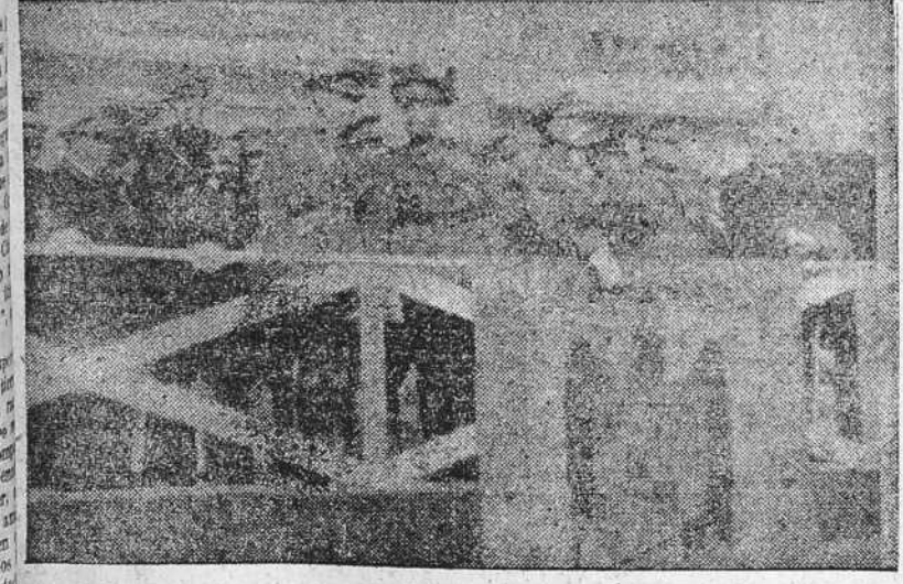
Notas gráficas del desfile militar celebrado en La Coruña el "Día del Caudillo". De arriba a abajo: Infantería, Artillería, Guardia civil, Policía Armada, Jerarquías de la Sección Femenina y Autoridades presenciando el paso de las fuerzas desde la tribuna instalada en el Cantón Grande. El público, congregado en las amplias avenidas, tributó cálidas ovaciones a los elementos que participaron en el desfile y vitoreó clamorosamente a España, a Franco y al Ejército.

NUEVA YORK 1.—En el diario neoyorquino "American", Lloyd George pide al Gobierno inglés la preparación inmediata de refugios subterráneos, tan profundos que no se oigan las explosiones de las bombas. Lloyd George justifica su petición en el hecho de que los incansables bombardeos de Londres y el insomnio de la población ha creado una tensión nerviosa que amenaza con quebrantar la moral del pueblo.—(EFE).