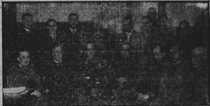
Jerarquías, autoridades y representaciones que asistieron a la constitución del sindicato del puerto de La Coruña

Al acto concurren las Jerarquías, Autoridades y representaciones relacionadas con el tráfico marítimo