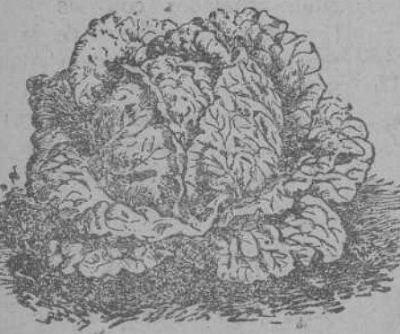
Lechuga de Repollo

Remolachas variadas; guisantes y judias. Tubérculos de flores variadas, gran surtido