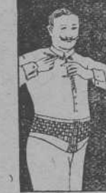
FAJA DE CABALLERO