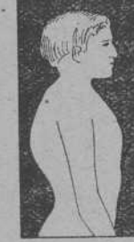
MAL DE POTT