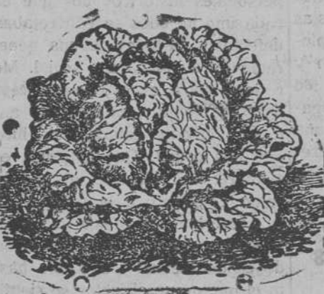
Lechuga de Repollo

Remolachas variadas; guisantes y judías. Tubérculos de flores variadas, gran surtido