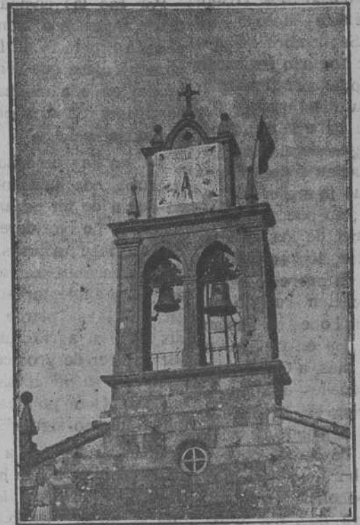
Una faceta del reloj de la parroquial de Domés.

habiendo dejado siempre gratísimo recuerdo y obras «sonantes y cantantes» de efectivo rendimiento educacional.