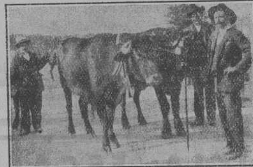
Soberbia yunta de bueyes laureada de primera en concursos anteriores.

El cultísimo profesor de la «Cátedra ambulante divulgadora»,