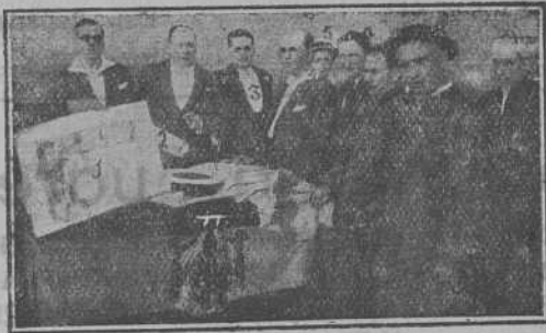
Distribución de premios y diplomas de la Asociación General de Ganaderos de España.

La «Cátedra ambulante divulgadora de la Dirección general de referidos 20 y 21, por cuya razón se adelantaron, los mencionados actos, para instrucción teórico-práctica, agro-pecuaria.