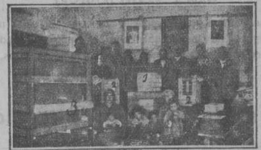
En el domicilio social, Detalle de Industrias rurales, Incubadoras de gusano de la Seda, Andanas, Colmenas movilizadas, Laboratorio social, Botiquín, etc.

hacer el reclamo, por ser sobradamente conocido de todos, la seriedad con que se han verificado estos actos, acreditados con millares de testimonios vivientes,