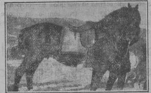
Un enx bre y brioso reproductor que mereció el primer premio en certámenes pasados.

formación para que concurren, con cuantos elementos agro-pecuarios tengan a su disposición Todos a la Feria y Fiestas económico-sociales de Domés (Orense). Mayo, de 1933.