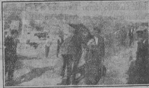
Un ganarón rebelde aspirante a premio.

2.º Se distribuirá profusión de impresos, folletos y libros de in-