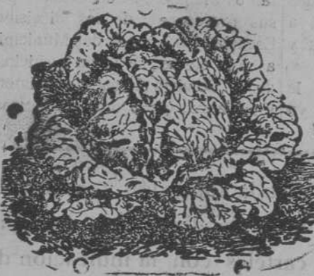
Lechuga de Repollo

Semillas de todas clases: hortalizas, forrajeras, y flores.