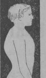
MAL DE POTT