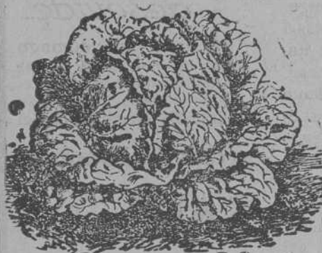
Lechuga de Repollo

Remolachas variadas; guisantes y judías. Tubérculos de flores variadas, gran surtido