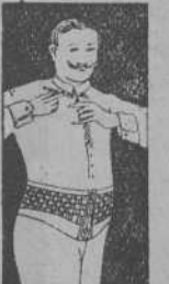
FAJA DE CABALLERO