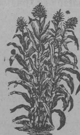
MAIZ.-Producción de 4 a 6 Espigas

Semillas de todas clases, hortalizas, orraieras y flores