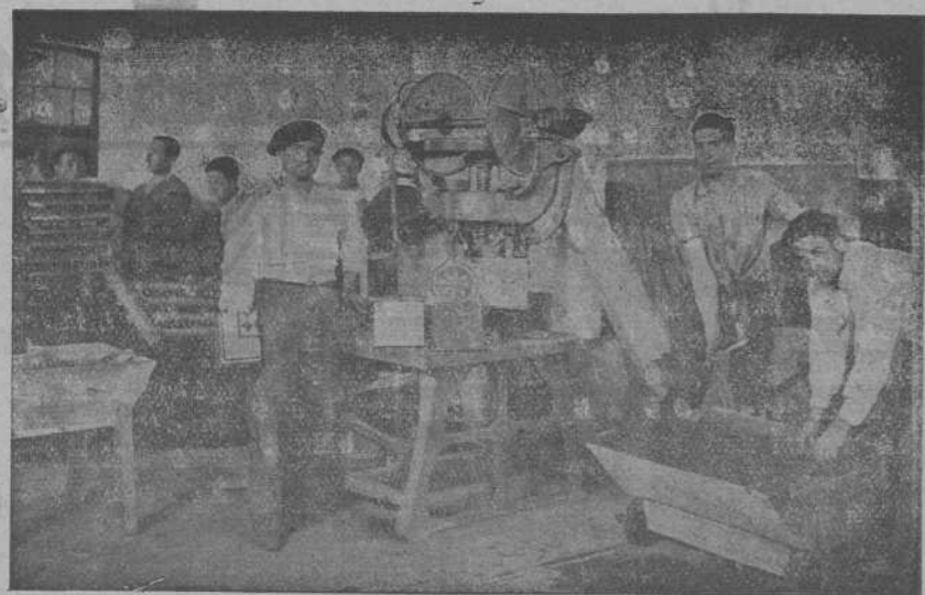
Vista de la sección de mosaico

Las especialidades de esta Fábrica, se basan en la fabricación de: Teja plana y curva, mosaicos, tuberías etc., por disfrutar de excelentes y seleccionadas arenas, mezcla mecánica y riego por cámara pulverizadora