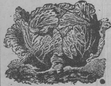
Repollo de Brunswick

Semillas de todas clases, hortalizas, forrajeras y flores. Repollo, lechugas, rábanos, sandías y espárragos. Para hacer prados: alfalfa, trébol, avena y cebada. Planchas para repujado, estaño, plata, latón y cobre, útiles para sus trabajos; patines, colores y pedrería! Fotografiado y sus útiles.