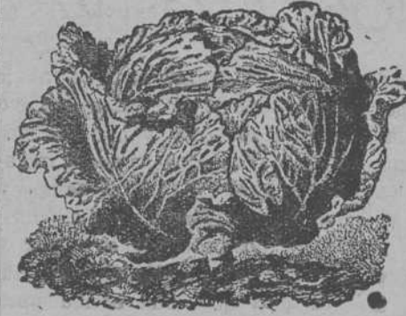
Repollo de Brunswick

Semillas de todas clases, hortalizas, forrajeras y flores.