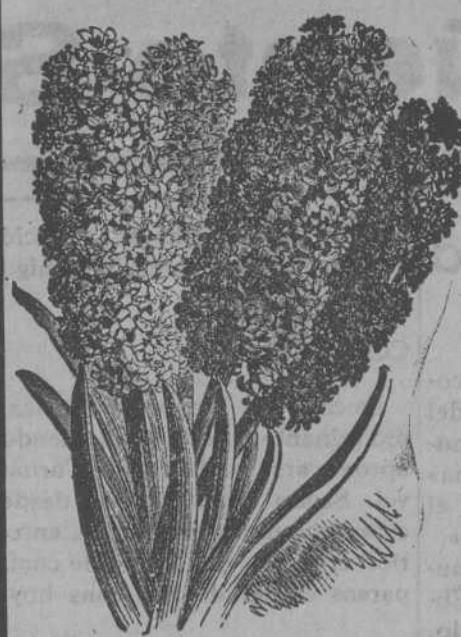
Jacintos dobles de Holanda

Arboles frutales y de adorno para Jardines y Macetas