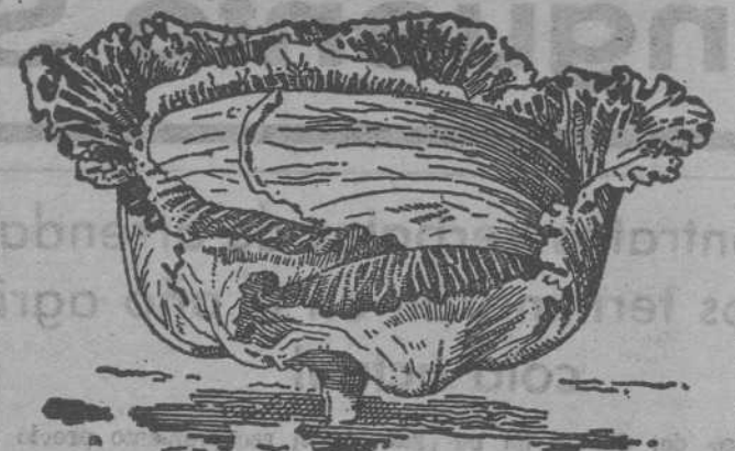
Repollo grande de Milán

Acelgas, Rabanitos y toda clase de hortalizas. Forrajerías, Sorgo azucarado, Sorgo del Sudán, Mostaza, Alfalfa, Remolacha, Trebó, Hierba para prados.