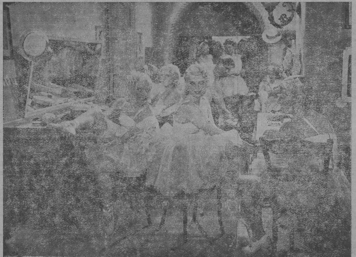
Uno de los momentos de la comedia musical de Cifesa, «Rosas del Sur.»