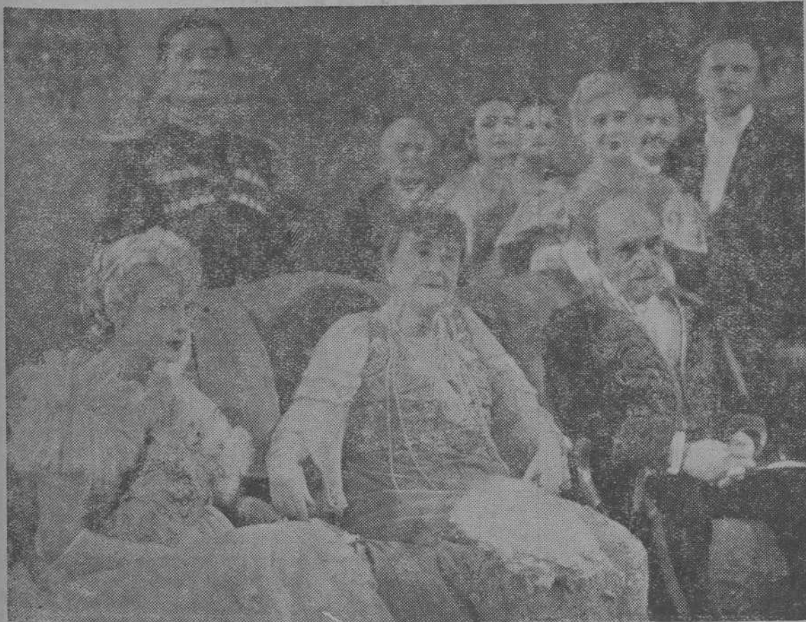
Una escena de la opereta alemana «Fiesta en Palacio» que distribuye Cifesa y protagonizan los conocidos artistas Ivan P'trouch y Camila Horn.