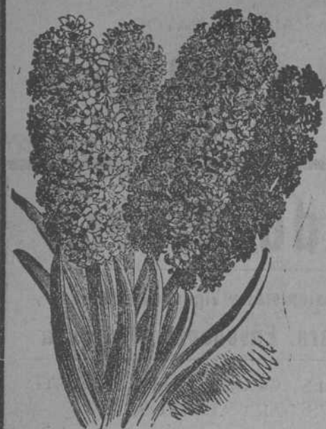
Jacintos dobles de Holanda

JOSÉ BLANCO VEGA :- Plaza del Hierro, núm. 1 (separatales)